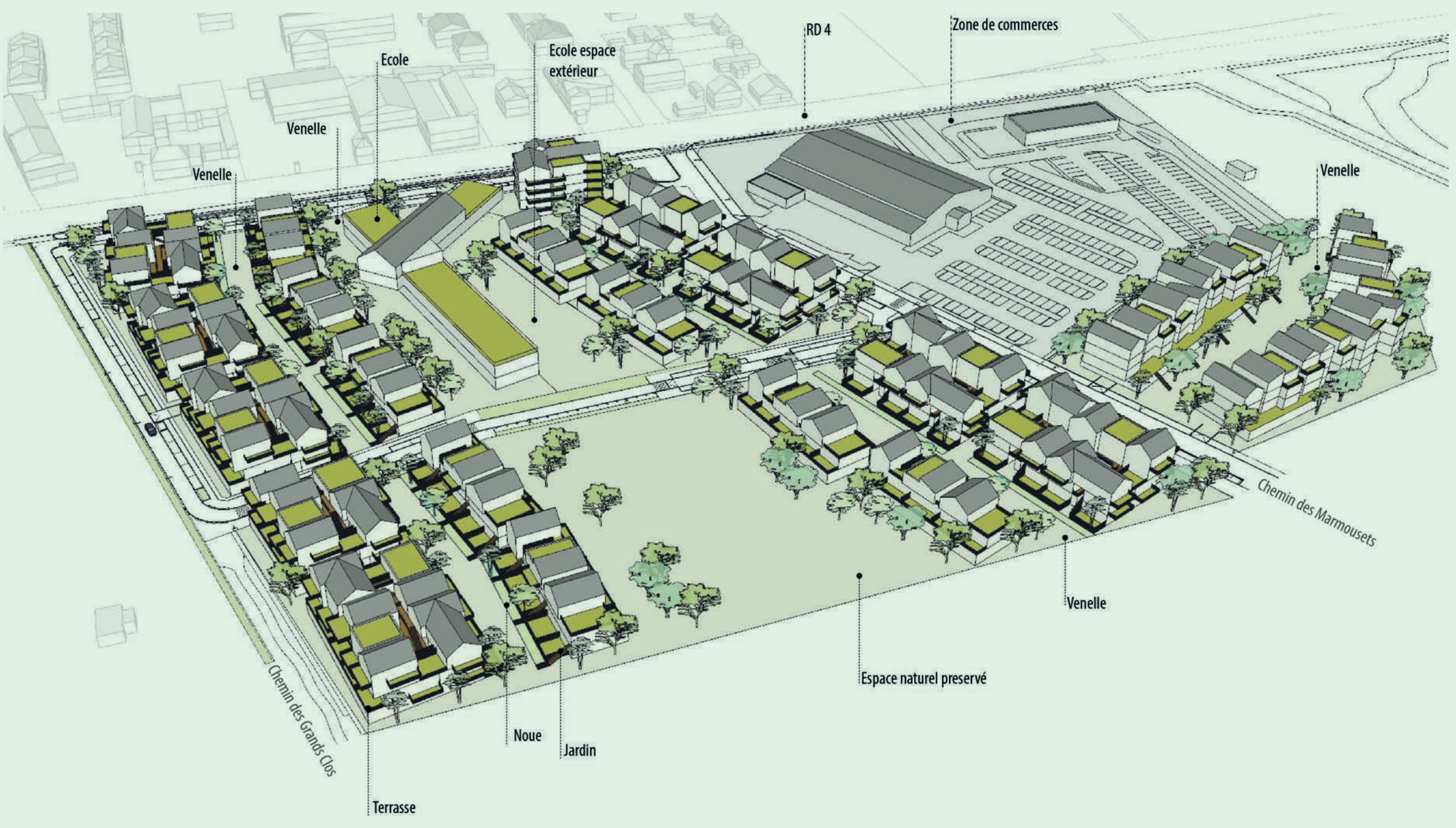
→ LE QUARTIER CONSTITUE UN FRONT DE TERRE S'OUVRANT SUR UN ESPACE DE NATURE PRÉSERVÉ EN LISIÈRE DE LA FORÊT NOTRE-DAME

→ Cette Z.A.C s'étend sur 24ha, mais seulement 10ha seront bâtis. Les espaces naturels au sud de la Z.A.C seront préservés pour leur grande qualité écologique. De fait, seuls les anciennes friches industrielles désaffectées et dépolluées au nord du site accueilleront des constructions.