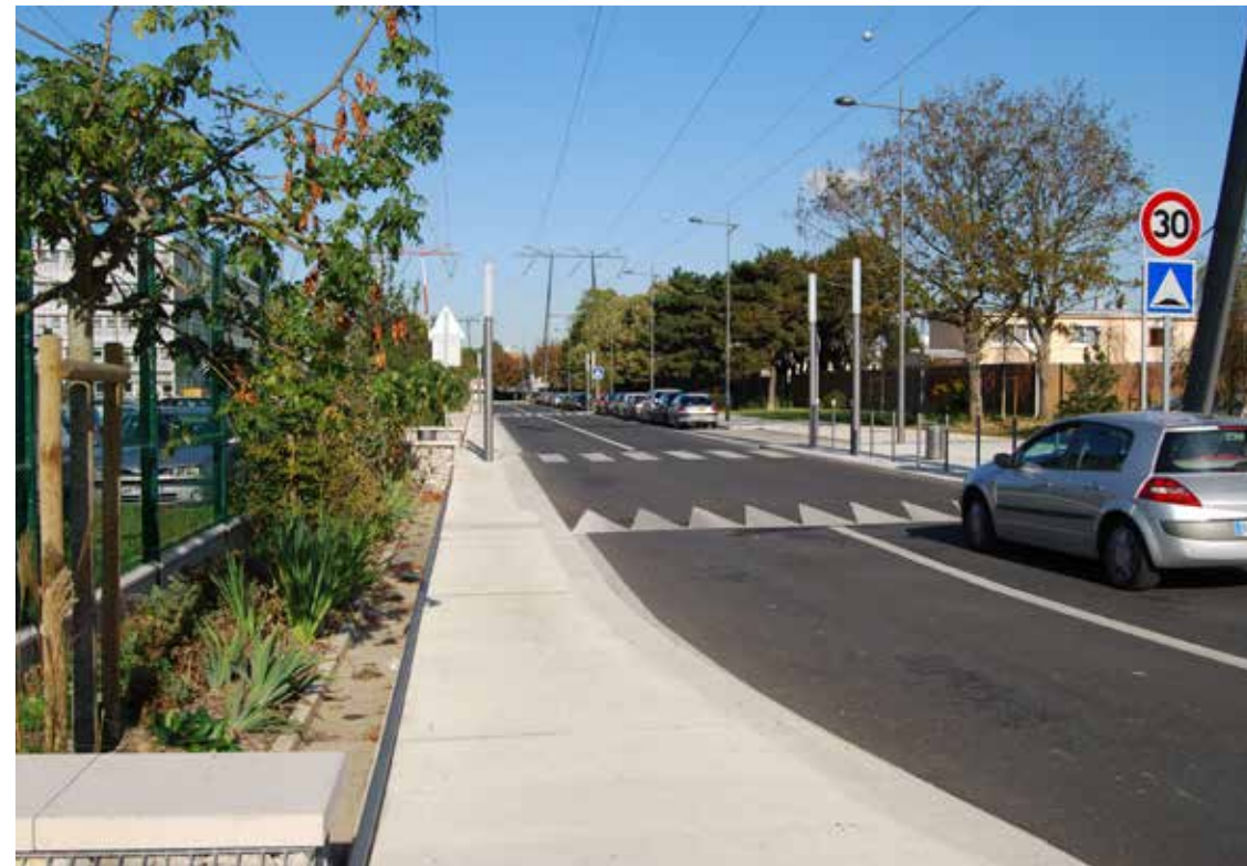
3 Plantations dans les noues urbaines subhorizontales pour la collecte et la régulation des eaux pluviales le long de la voirie et des parkings.