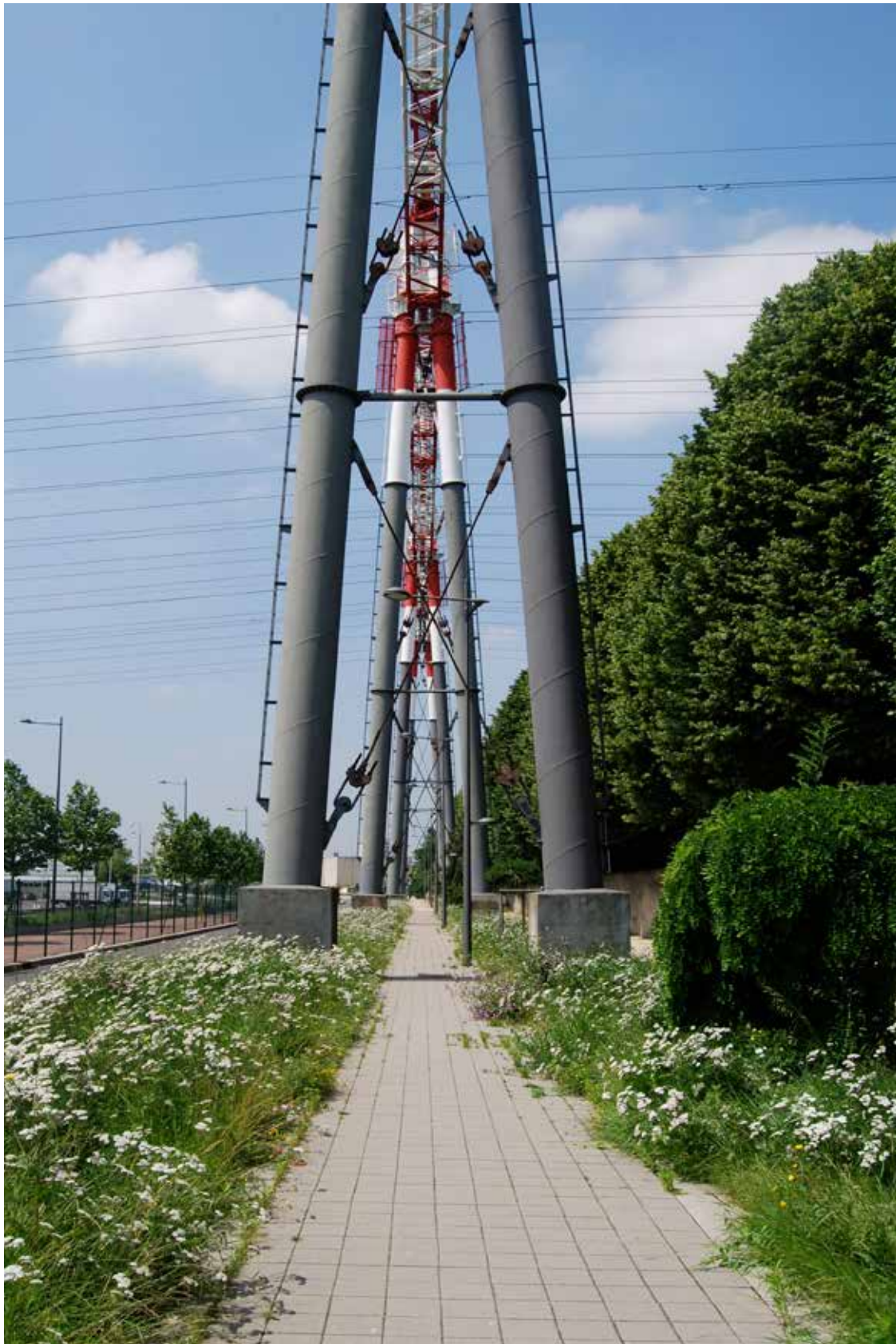
1 Trottoir de l'avenue du 8 Mai 1945 le long des lignes électriques très haute tension.