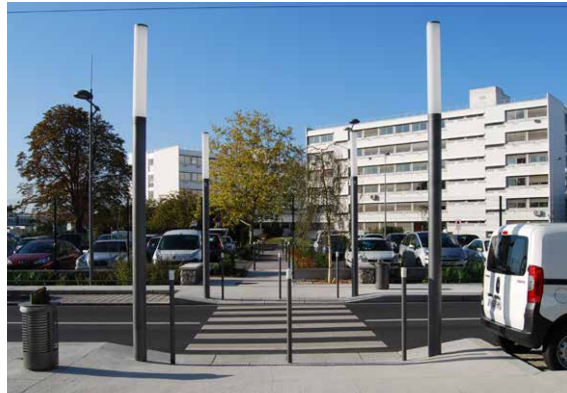
2 Passage piéton de l'avenue du 11 Novembre 1918 donnant sur le parking planté ainsi que le complexe de bâtiments sociaux de la Rue de la Lingerie.