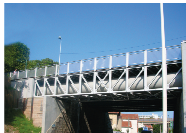
Passerelle rue de la Convention