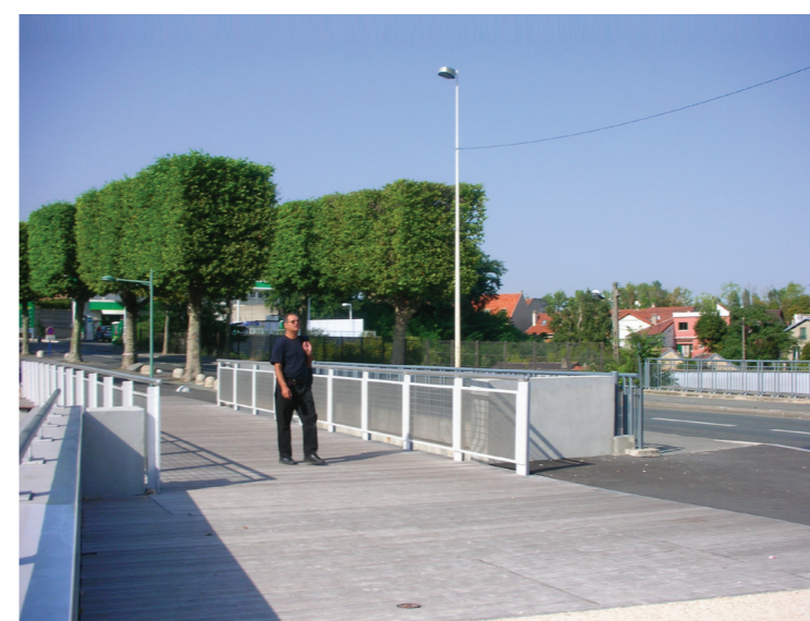
Promenade de l'avenue Paul Doumer