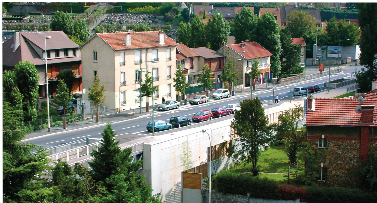
Vue de la passerelle sur la rue de la Convention