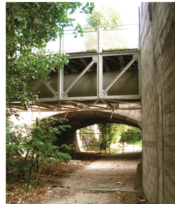
Passerelle de la Bièvre